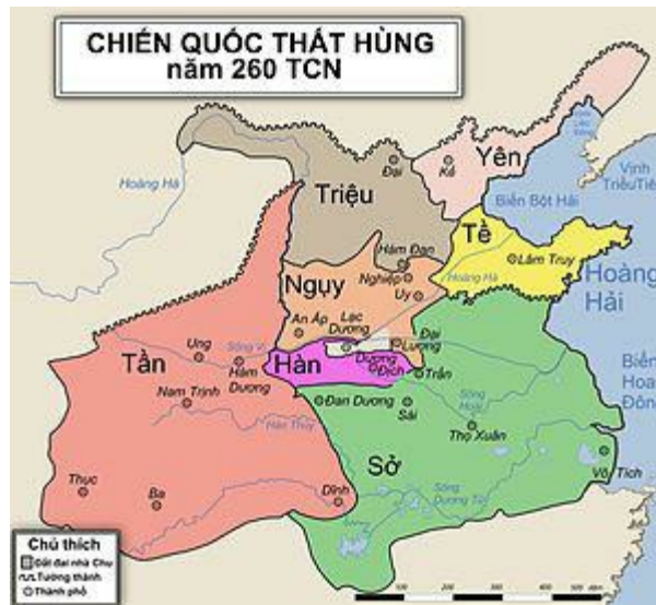
Bản đồ thời Chiến Quốc năm -260

Những niên đại trên đều theo Vũ Đông, tác giả cuốn Trung Quốc triết học đại cương ”. ( Sử Trung Quốc , trang 114-115).