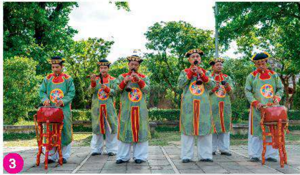
Nhã nhạc cung đình Huế, Thừa Thiên Huế