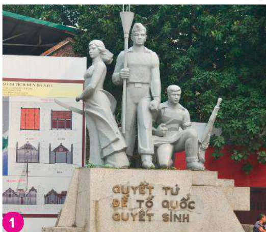
Tượng đài Quyết tử để Tổ quốc quyết sinh, Hà Nội

Em hãy quan sát các hình ảnh dưới đây và trả lời câu hỏi: