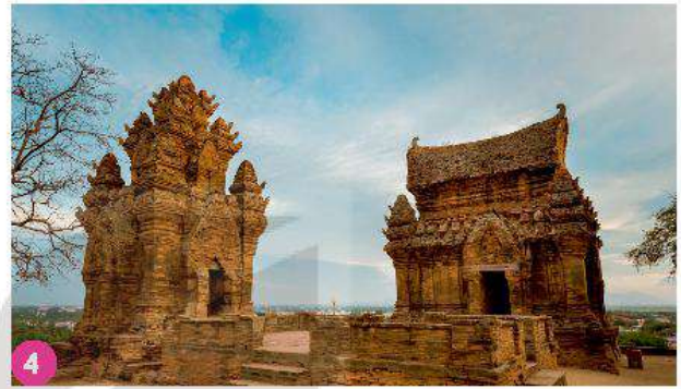
Tháp Chăm, Ninh Thuận