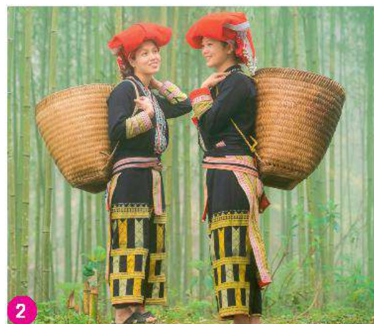
Người Dao Đỏ ở Lào Cai trong trang phục truyền thống