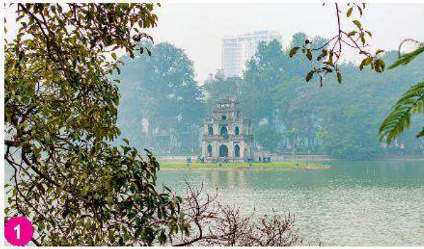
Hồ Gươm, Hà Nội