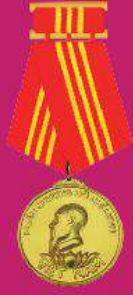
HUÂN CHƯƠNG HỒ CHÍ MINH