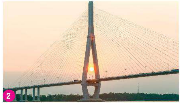
Cầu Cần Thơ, thành phố Cần Thơ