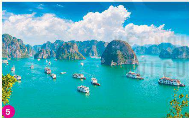
Vịnh Hạ Long, Quảng Ninh