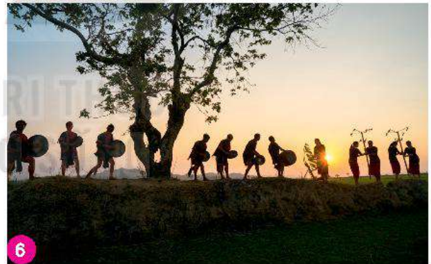
Không gian văn hoá Cồng chiêng Tây Nguyên