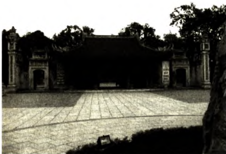
Ảnh 13. Đền thờ Hai Bà Trưng, xã Mê Linh, huyện Mê Linh, Hà Nội