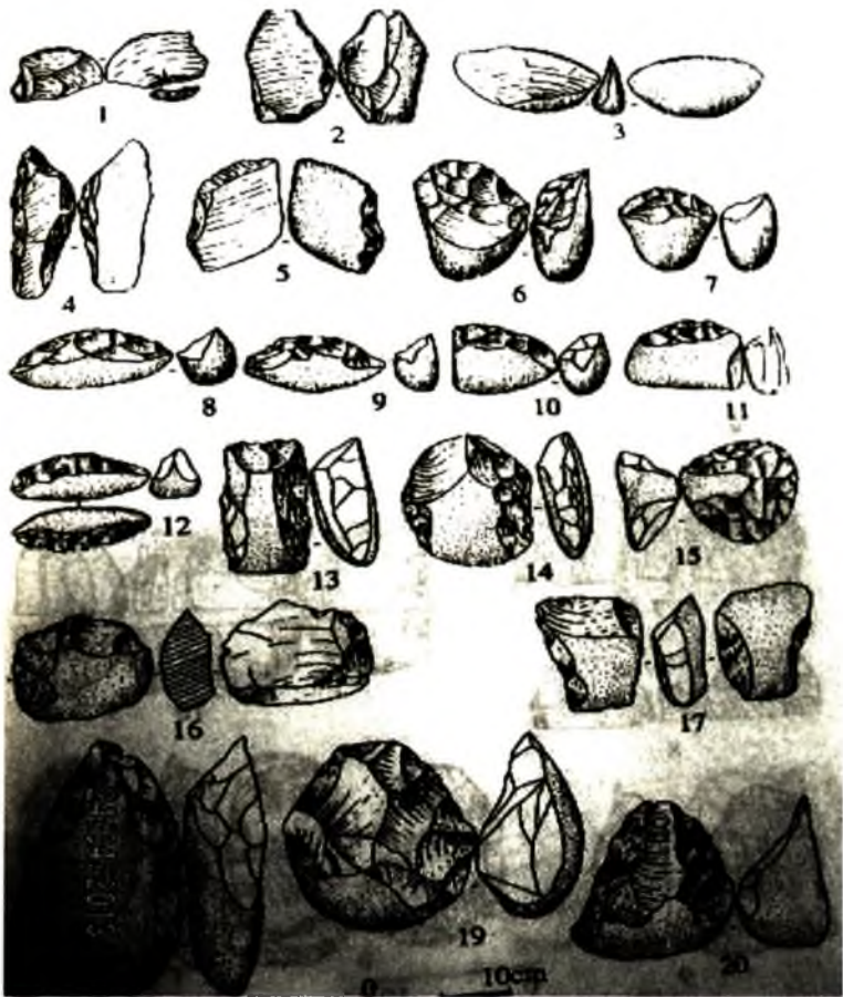
Ảnh 2. Công cụ đá cuội Văn hóa Sơn Vi: 1-3 Mảnh tước, 4-5 Cuội bở, 6-20 Công cụ cuội