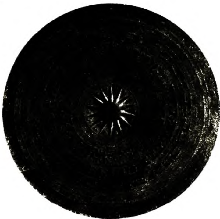
Ảnh 6. Mặt trống đồng Ngọc Lũ, Hà Nam