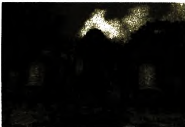
Ảnh 14. Tháp Bà Ponaga, Nha Trang, Khánh Hòa, thế kỷ IV-VIII