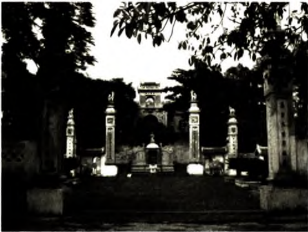
Ảnh 11. Đền Công, Diển Châu, Nghệ An - nơi thờ Thục An Dương Vương