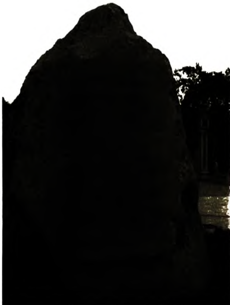
Ảnh 12. Lời thê của Hai Bà Trưng - Đền Hai Bà Trưng, xã Mê Linh, huyện Mê Linh, Hà Nội