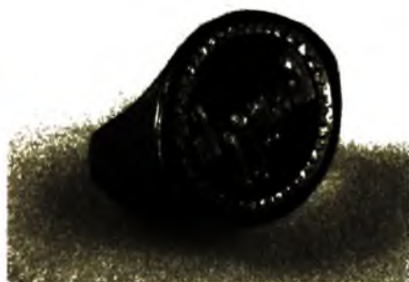
Ảnh 17. Nhẫn vàng Văn hóa Óc Eo, Nam Bộ