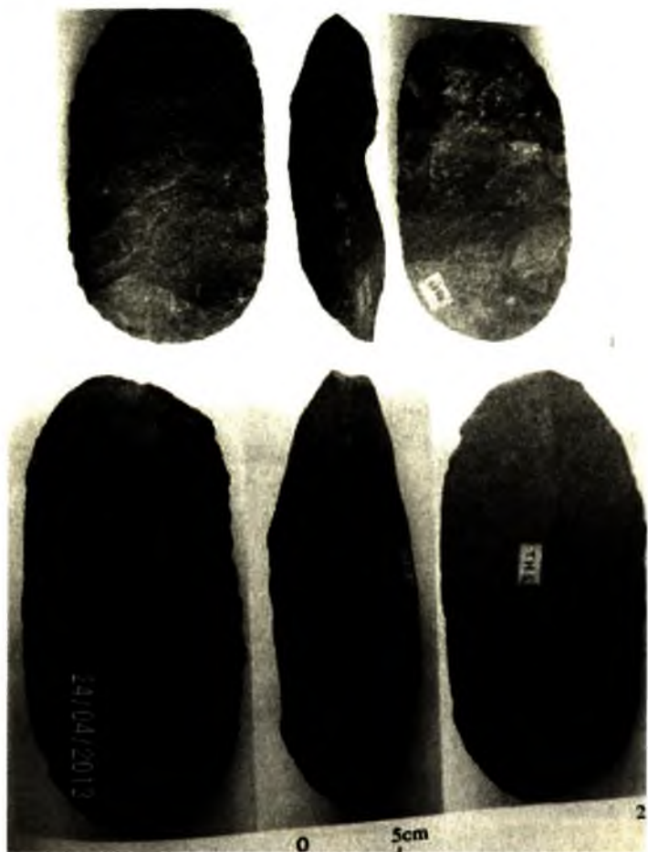
Ảnh 3. Công cụ đá cuội hình hạnh nhân Văn hóa Hòa Bình