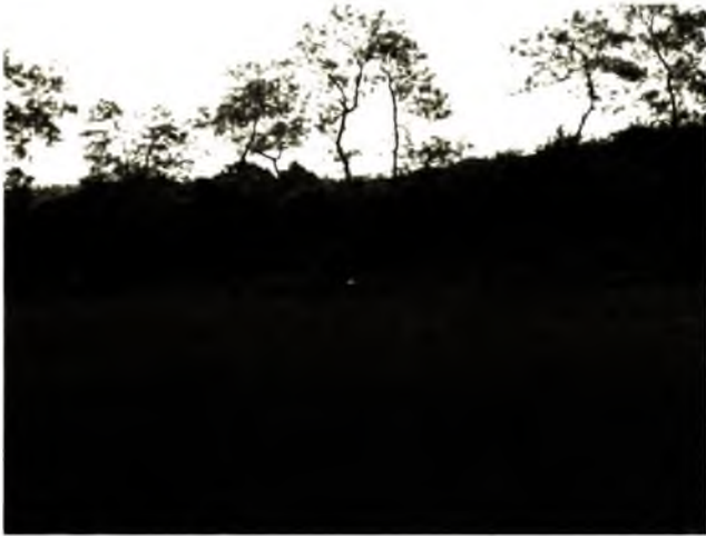
Ảnh 10. Di tích một đoạn thành Cổ Loa phía tây