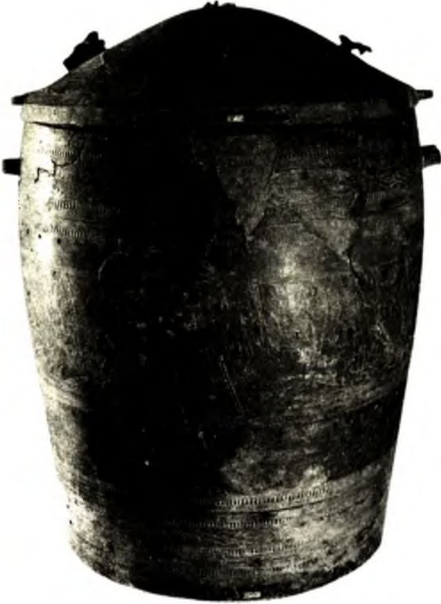
Ảnh 8. Thạp đồng Đào Thịnh, Yên Bái