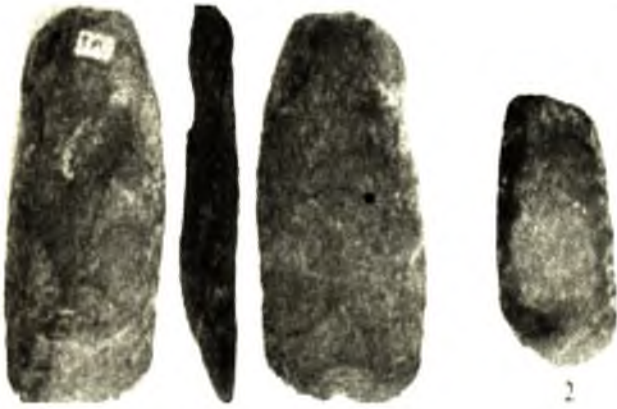
Ảnh 4. Rìu ngắn Hòa Bình