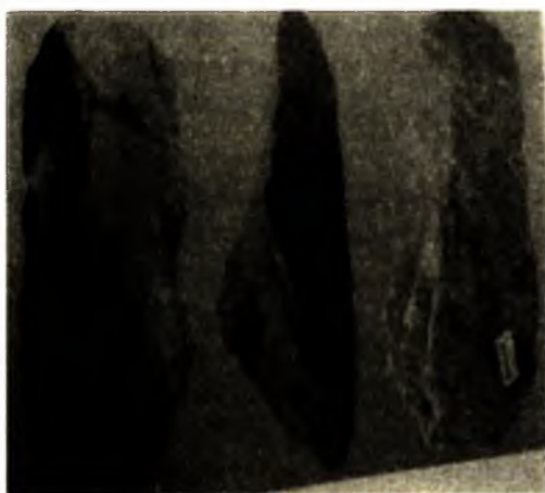
Ảnh 1. Công cụ Văn hóa đá cũ sơ kỳ (di tích Núi Đọ)