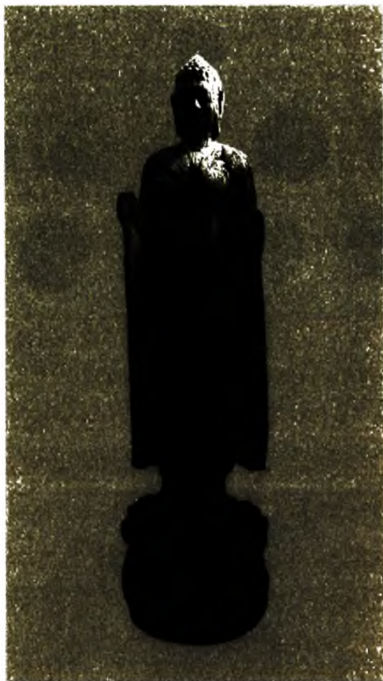
Ảnh 18. Tượng phật Văn hóa Óc Eo, Nam Bộ