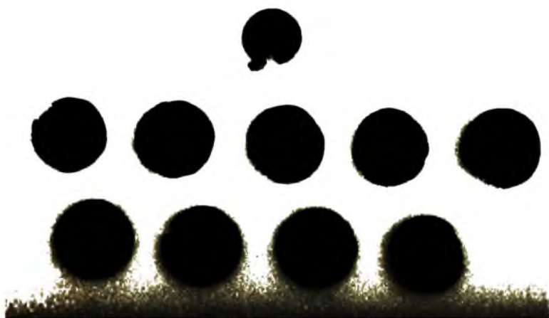
Ảnh 16. Bộ sưu tập tiền cổ Văn hóa Óc Eo, Nam Bộ