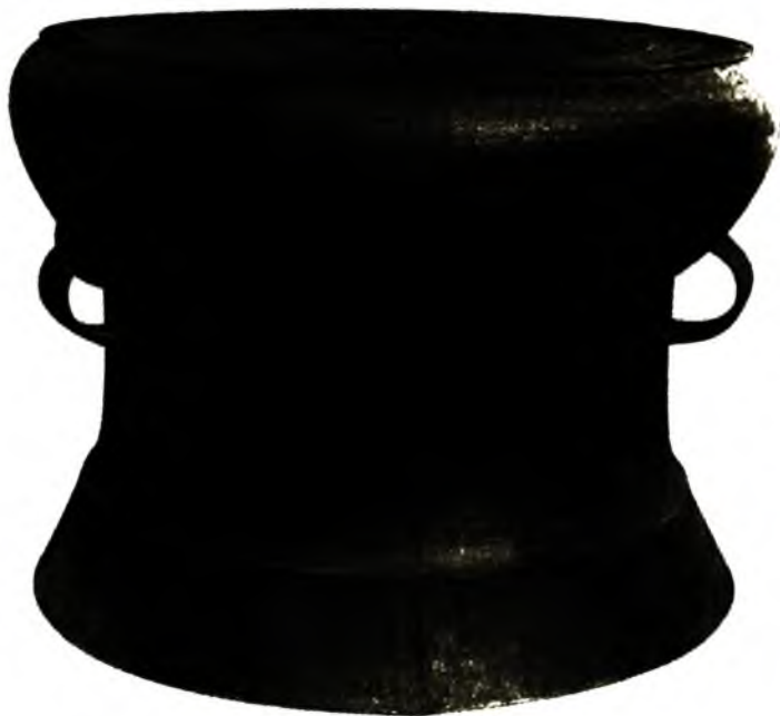
Ảnh 7. Trống đồng Ngọc Lũ, Hà Nam.